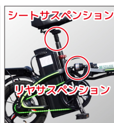
シートサスペンション