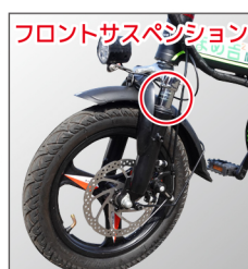
フロントサスペンション